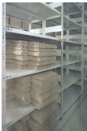
A kiterítve leszállított dobozok

A megvásárolt 686 darab doboz 68,60 iratfolyóméter iratanyag tárolásához elegendő.