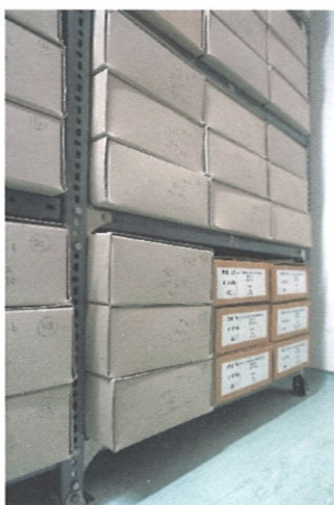
A savmentes dobozba átrakott és még átdobozolásra kerülő árvaszéki iratok

Vác Város Levéltára folyamatosan dobozolja át a régebben rendezett, nem savmentes dobozokban tárolt iratanyagot. Ilyen iratanyag a V. 94-b Vác Város Árvaszékének iratai, melynek átdobozolása jelenleg is folyik. A tervezett átdobozolás kb. 40%-át végeztük el, 1872-től az 1920-as évvel bezárólag. Az árvaszéki iratanyag 1950-el zárul.